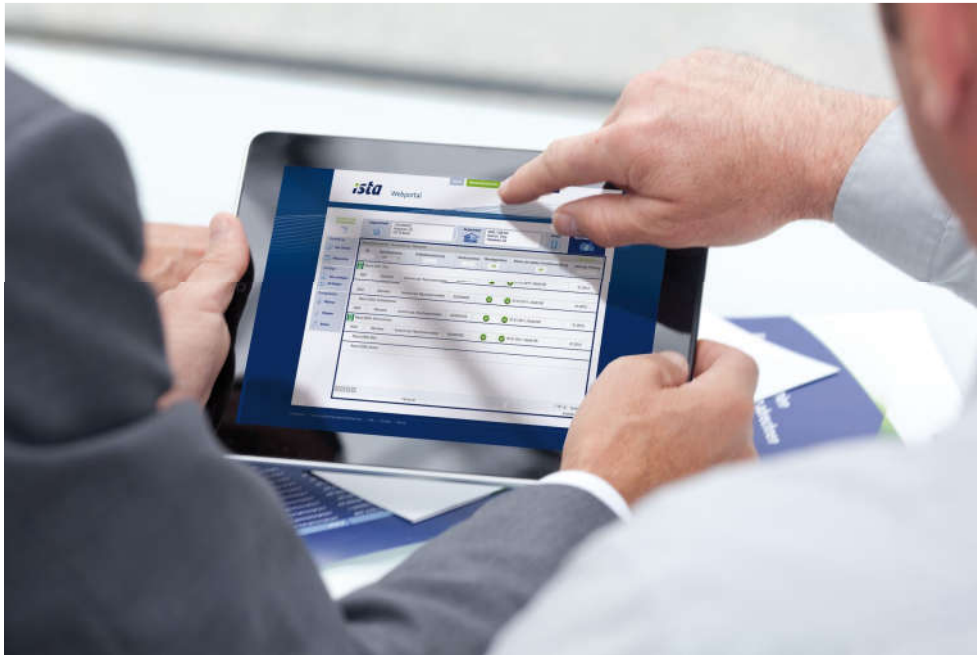
Ista | Webportal per gli amministratori di condominio.

L'infrastruttura digitale può essere adoperata anche per altre applicazioni, come per esempio, dispositivi digitali di allarme antifumo che possono essere verificati da remoto, incrementando il livello di sicurezza dei residenti.