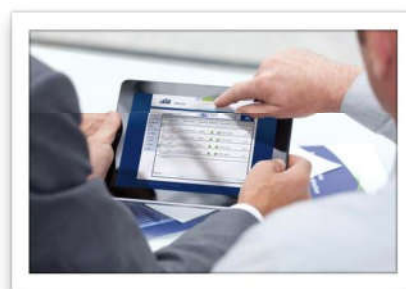
Webportal - portale impianti per Gestori e Amministratori_mid.jpg

Ista | Servizi digitali per i condomini.