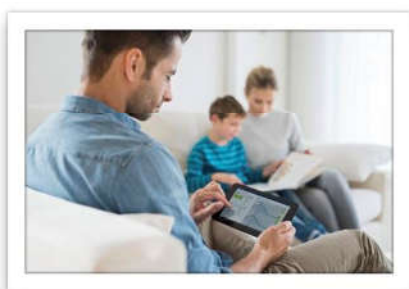
Portale utenti ista connect.jpg

Questo facilita l'incremento dell'efficienza energetica e di conseguenza, il valore della proprietà . Quindi, inquilini e proprietari contribuiscono attivamente alla tutela del clima e risparmiano almeno il 20 % sui consumi e costi annui di riscaldamento. In Germania, ad esempio, i proprietari e gli inquilini tagliano le emissioni di CO 2 di circa 4 milioni di tonnellate.